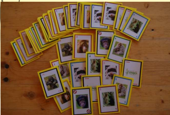
Des jeux de société pour apprendre en s'amusant...