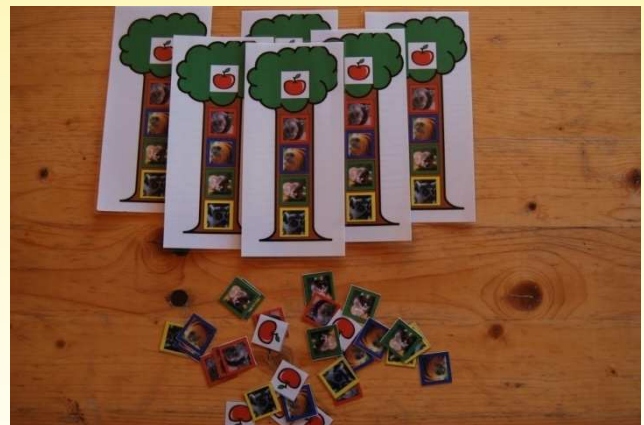
Jeu de l'arbre