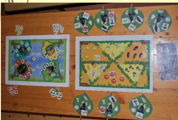
Exemples de jeux