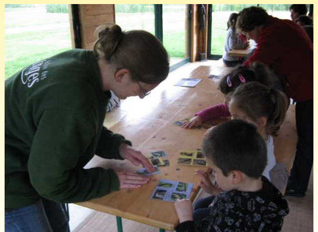
Jeu de loto sur le thème de la locomotion