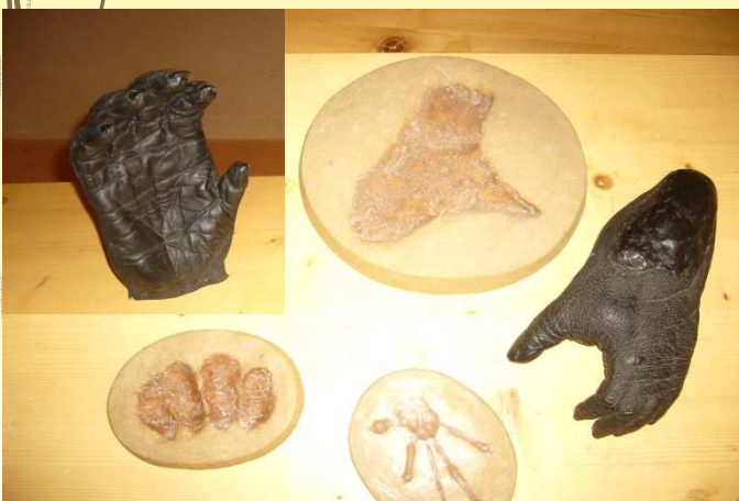
Empreintes et moulages de mains et de pieds