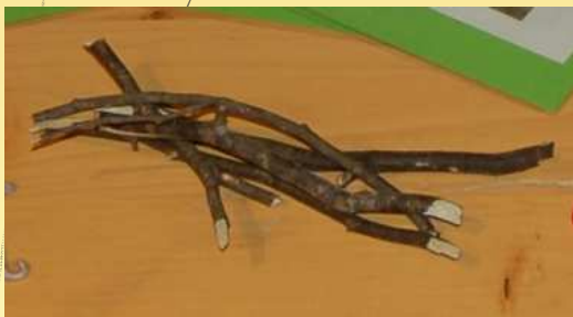
Manipuler des branches imprégnées de l'odeur des animaux