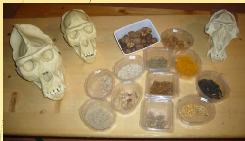
Reproductions de crânes et échantillons des différents aliments donnés aux singes